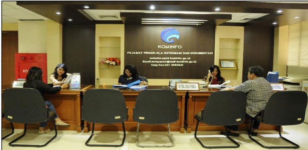
DESK LAYANAN INFORMASI PUBLIK

Pejabat Pengelola Informasi dan Dokumentasi dalam pelaksanaan tugas pelayanan informasi untuk tahun 2017 menyediakan 10 sebagai upaya untuk meningkatkan pelayanan informasi bagi masyarakat.